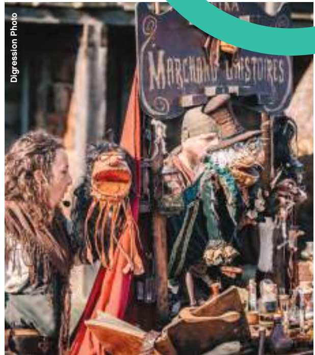
Razel la sorcière : spectacle de la cie Lutka

Pour en savoir plus : retrouvez le programme des animations sur les réseaux sociaux et le site dédié au marché.