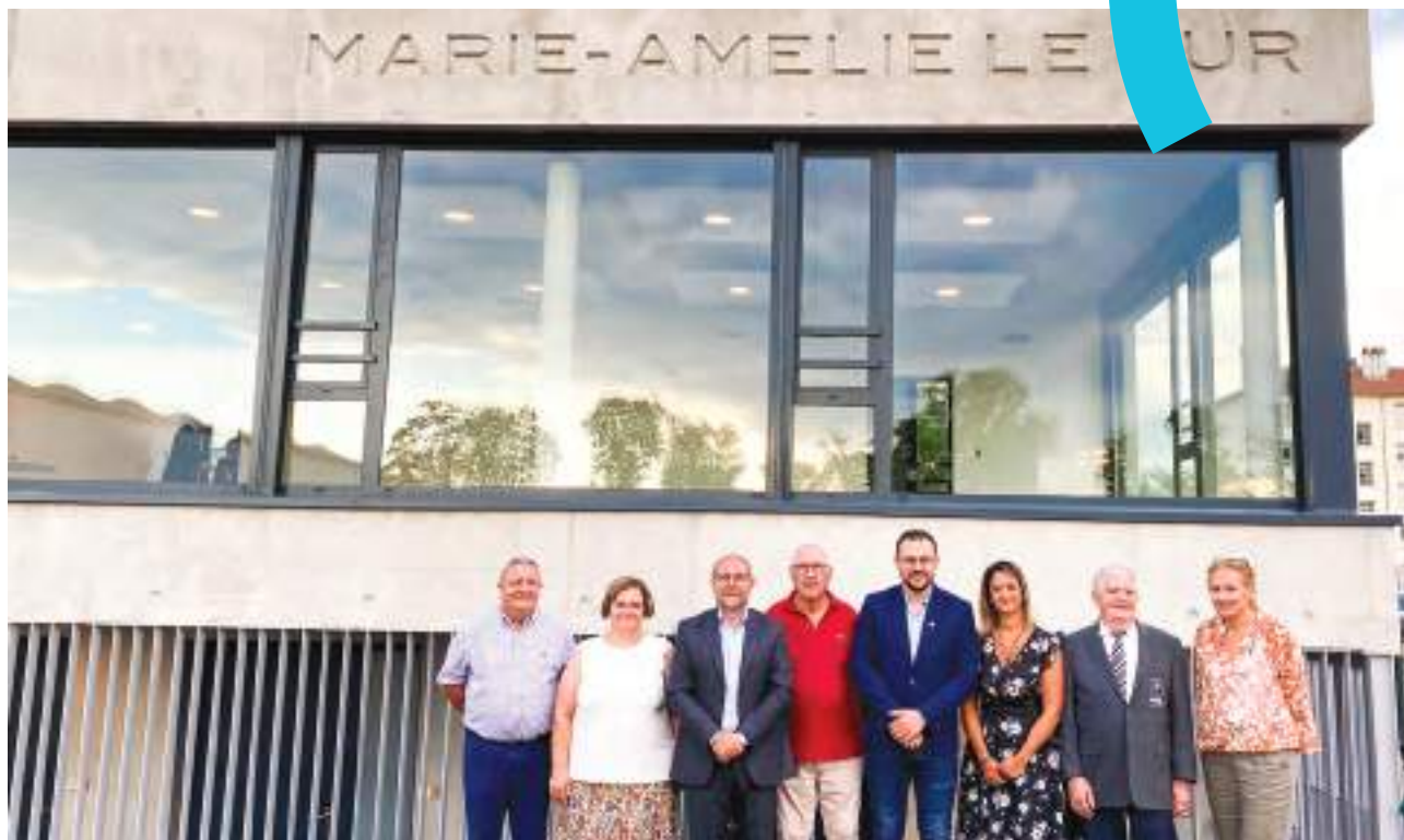
Inauguration du Pôle Sportif Marie-Amélie Le Fur

Le 3 septembre était placé sous le signe associatif. Le forum des associations ouvrait la journée, suivi de l'inauguration du Pôle Sportif Marie-Amélie Le Fur pour se clôturer par un barbecue convivial avec les acteurs du monde associatif.