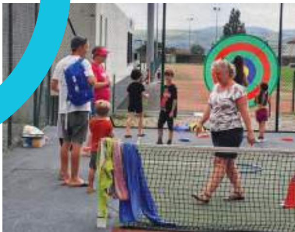
Le Forum des associations