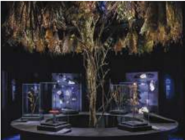
L'exposition « Magique » du Musée des Confluences

Cette année encore, nous proposerons de nouvelles animations pour enfants et adultes, fans ou néophytes de la célèbre saga. Et pour la première fois, un partenariat a été signé avec le Musée des Confluences.