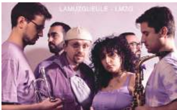
Lamuzgueule : des mélodies, en Français et en Anglais

> 17h30 > Spectacle L'arbre à conte - Cie D'à Côté Il fut un temps où les arbres parlaient... Suspendu entre ciel et terre, une bulle de douceur, de rêve et de poésie.