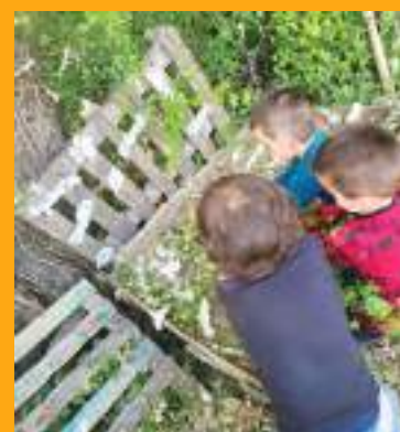
Les enfants suivent de près l'évolution de leurs plantes aromatiques

Rempotage, plantations, arrosage... ces tâches n'ont plus de secrets pour ces jardiniers en herbe avec Lulu et Sailina, leurs animatrices motivées et toujours de bonne humeur !