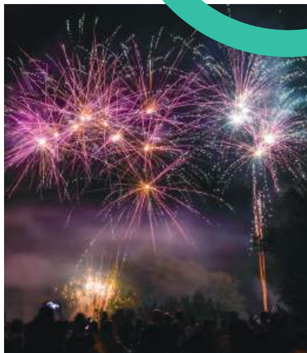
Feu d'artifice sur les berges du Rhône, suivi d'un bal animé par un DJ

> 21h > Concert Lamuzgueule Entre clash électronique et Flash-back swing, mais aussi des cuivres et des claviers, Lamuzgueule se joue des époques et des styles. Le groupe cartonne sur les scènes du monde entier grâce à sa vision de la French touch et d'un live déchaîné et souriant.