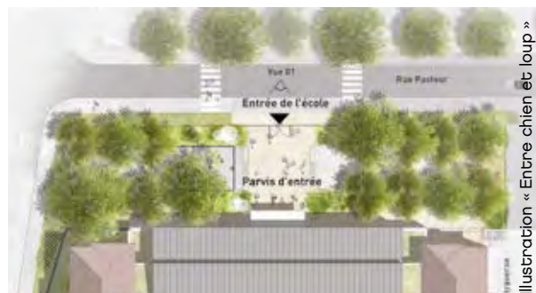
Illustration « Entre chien et loup »

Nous souhaitons que les espaces extérieurs soient aussi des lieux de vie du quartier. Les planades