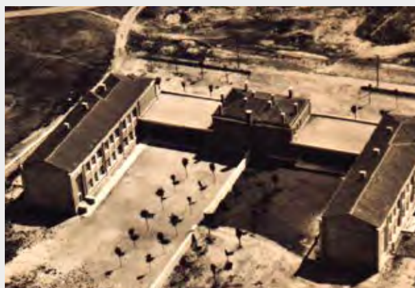
L'école Pasteur, inaugurée en 1959, était alors au milieu des champs.