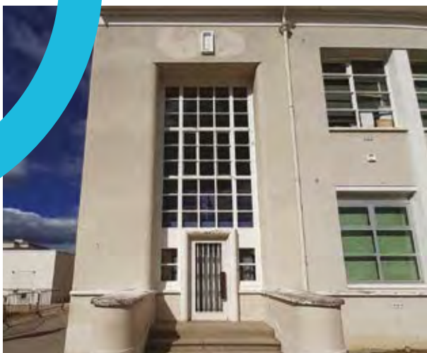
Dessinée par l'architecte lyonnais Alexandre Audouze-Tabourin, l'école a été construite en 1954.

d'entrée devient un espace vert, de vie et de jeux ouvert aux habitants les week-end et les vacances scolaires. Nous avons aussi intégré une annexe de la médiathèque pour les élèves et pour les habitants.