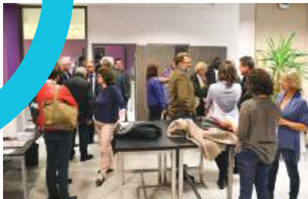
L'inauguration du Coworking, le 4 octobre 2017